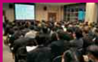
会場が満員となった地域説明会。地域住民の関心の高さが表れました

4広域振興局への移行は平成22年4月。県は今後も検討を重ね3月に「考え方(案)」、6月に「考え方と実施案」を示し、地域説明会やパブリックコメントも行いながら最終的な考えをまとめ、9月の県議会で関連条例を提案、決定することを目指しています。