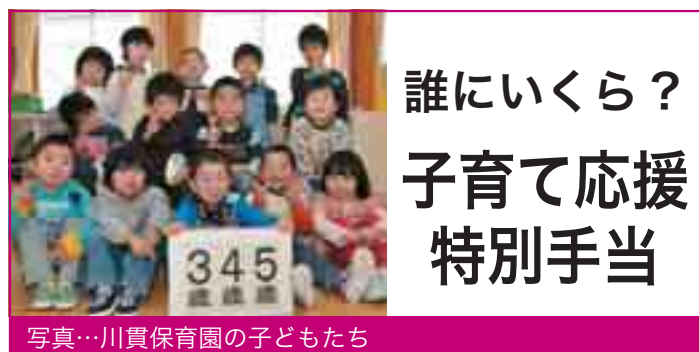
写真…川貫保育園の子どもたち