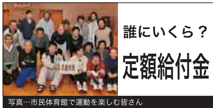
写真…市民体育館で運動を楽しむ皆さん