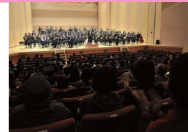
成果を見せた奏者に大きな拍手

技術向上を目指して昨年5月から計6回行われた吹奏楽クリニック。その成果を発表する吹奏楽祭（市文化会館主催）は2月22日、アンバーホールで開かれました。