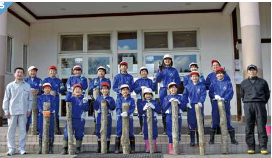
1 / あっという間に穴が出来上がる電動ドリルにちょっと緊張 2 / 説明をきちんと聞きながら、作業を進めます 3 / 種駒をハンマーで打ち込む作業は、ストレス解消にもなるそうです (児童談) 4 / 丁寧に教えてもらいました。平らに打ち込めているか、手で感触を確かめます 5 / 自分が植菌した原木を持ち、満面の笑みで記念撮影。収穫が楽しみです