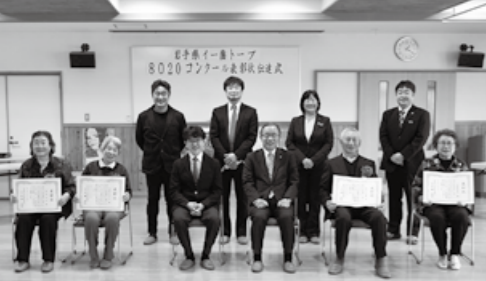
笑顔で表彰状を掲げる表彰者