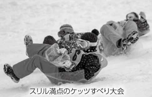
スリル満点のケツすべり大会

■ 接種会場 ：詳しい日時や場所、ワクチンの種類は予約時に確認ください ① 個別接種(医療機関) ② 集団接種(市民体育館) ③ 3回目の接種券について ： 3回目の接種券は、予約票に印字されている「接種券付き予約票」です(これまでのようなシール状のものではありません) ■ 接種会場に必要な書類 ： ① 接種券付き予約票 ② 予防接種済証と記載されている案内文書 ③ 本人確認書類(保険証など) ■ ワクチンの種類と量 ① ファイザー社製：0.3ml(前回と同量) ② 武田/モデルナ社製：0.25ml(前回の半量)