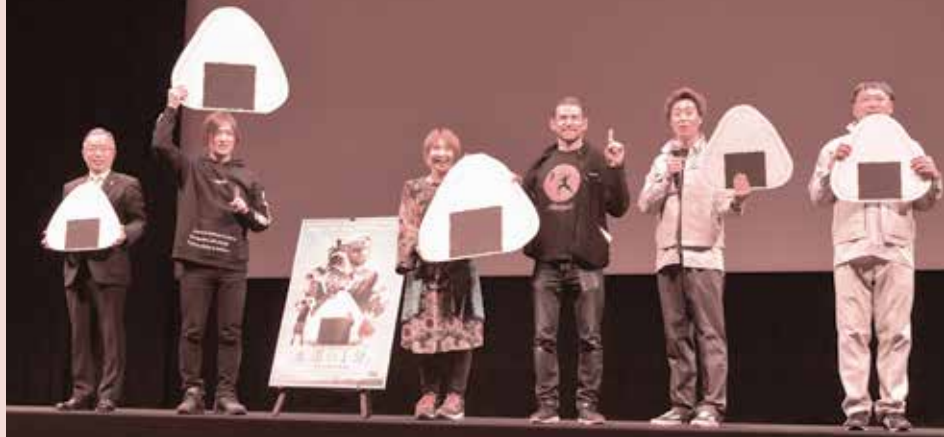
舞台あいさつ後に記念撮影