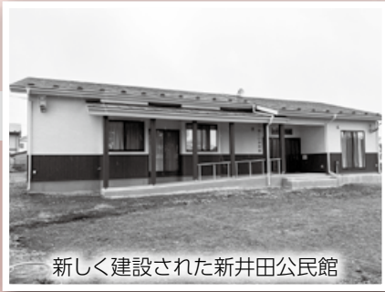
新しく建設された新井田公民館