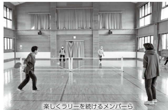
楽しくラリーを続けるメンバーら

クローバーの会は、テニスと卓球を組み合わせたニュースポーツ、テニポンのサークルで、平成25年10月に結成しました。長内市民センターで毎週火曜日と木曜日に活動を行っています。テニポンは、バドミントンコートを使用し、卓球のラケットのような形をした木製のラケットで、直径9センチほどのスポンジのボールを打ち合います。サークルでは、ルールや勝負にこだわらず、ミスも笑いとばして運動しています。気心知れた仲間と会えるのも楽しみのひとつ。和気あいあいと運動し、健康維持に努めています。