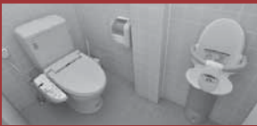
▲女子トイレ 男子トイレ▶