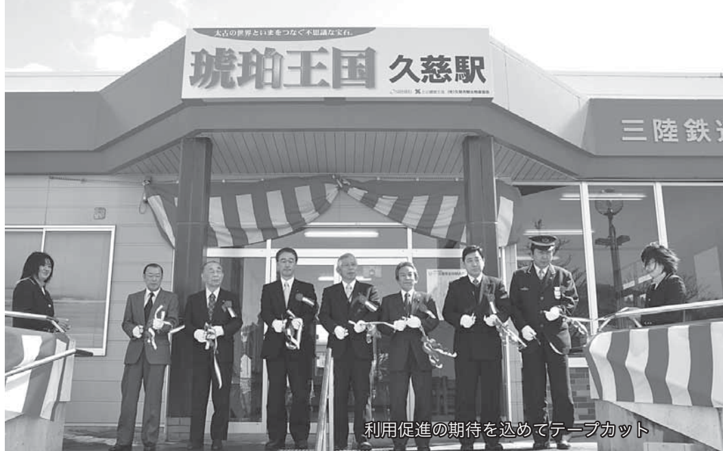
利用促進の期待を込めてテープカット