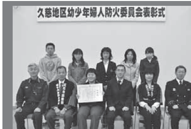
受賞者と関係者の皆さん

久慈地区幼少年婦人防火委員会表彰式が3月24日、防災センターで行われ、市内から7人が表彰されました。受賞者は次のとおりです。(敬称略)