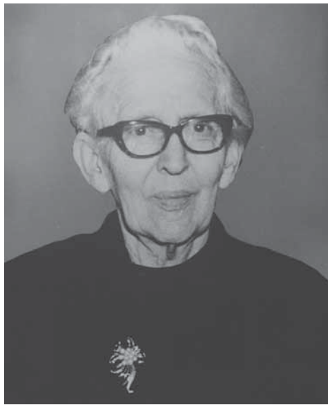
姉妹都市を結びきっかけとなった