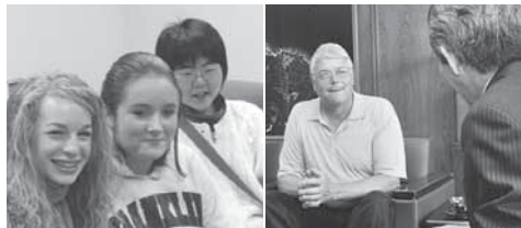
中高生海外派遣で交流 本市を訪問したパリ市長