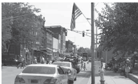
右/市民の交流の場にもなっている郡裁判所はフランクリン市のシンボルの一つ上/メインストリートのジェファーソン通り。毎日、多くの人が行き交います