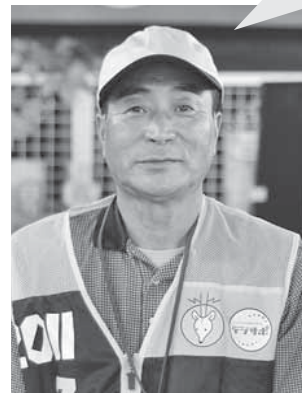
デジサポ岩手地デジサポーター つきのきさわ電器