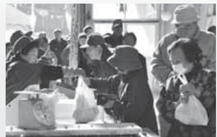
行列ができ、活気にあふれる二子朝市

市には新巻サケやイクラ、ナマコなどがずらり。特にアワビには開店と同時に人が殺到し、追加販売になるほどの盛況ぶりでした。