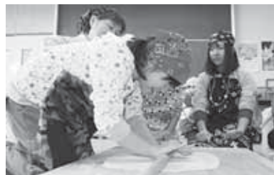
なれない手つきで、作業に挑戦する児童

12月11日、結成3年目の小久慈町まちづくり協議会(水上貴一会長)が大川目町まちづくり協議会(外館孝会長)を訪問し、活動の現状や課題について意見交換。懇親会では地域おこしや後継者について語り合い、交流を深めました。(小倉利之リポーター)