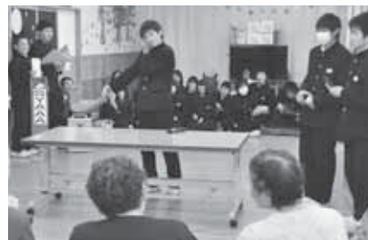
耳からハンカチを出す手品に会場は大爆笑