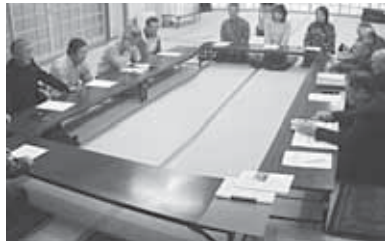
地域活性化のため、語り合った両協議会