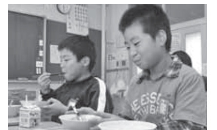
短角牛のビーフシチューをほおぼる児童