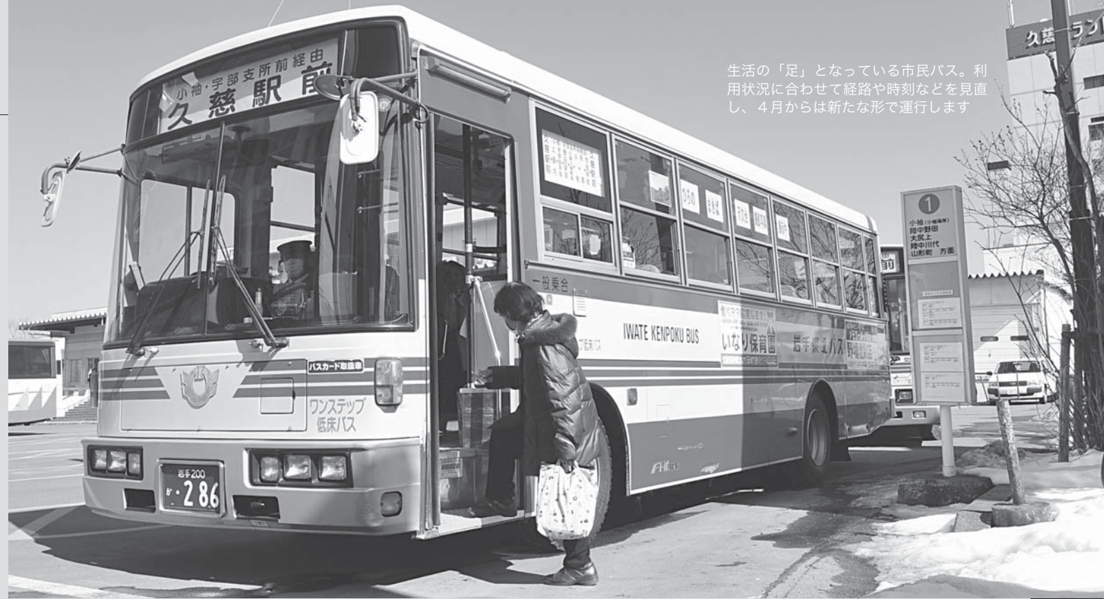
生活の「足」となっている市民バス。利用状況に合わせて経路や時刻などを見直し、4月からは新たな形で運行します

経費は、これからも増え続けていきます。市の財政も苦しい状況が続く中、このままだと、いつか市民バスを存続することが難しくなってしまうかもしれません。生活の「足」は、今とても厳しい状況に置かれています。市民バスを支える存在。それは名前の通り「市民の皆さん」です。これからも運行し続けるためには、皆さんの利用が必要です。どうか皆さんのご理解とご利用をお願いします。