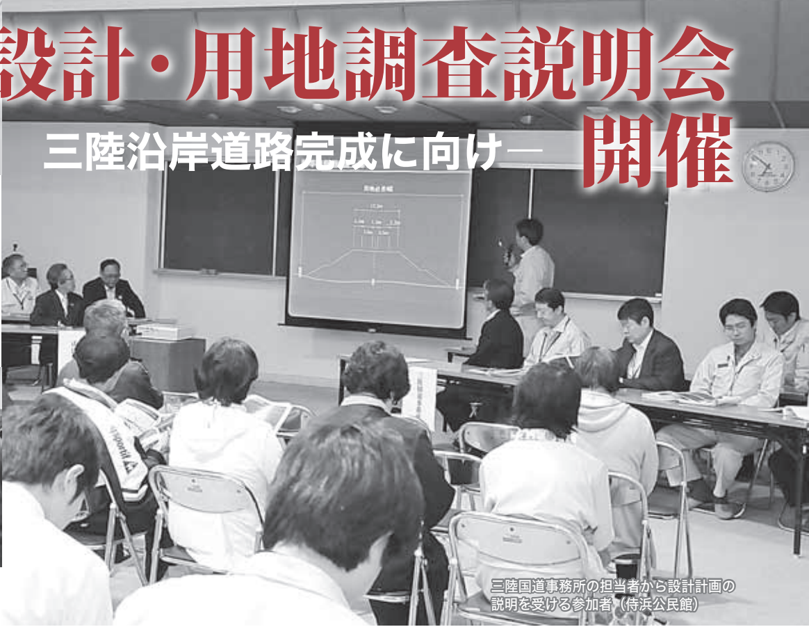
三陸国道事務所の担当者から設計計画の説明を受ける参加者(待浜公民館)