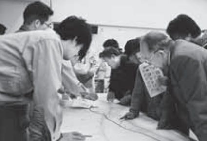
上/貼り出されたルートを確認する参加者 下/全体の説明会の後、個々の質問に対応する担当者

平成24年(2012年) No.153 〔ホームページアドレス〕 http://www.city.kuji.iwate.jp/