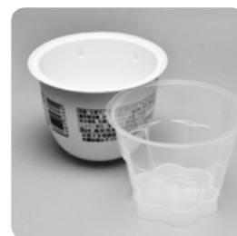
プリン・ゼリーの容器