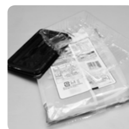
お菓子の袋・容器