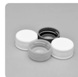
ペットボトルのキャップ