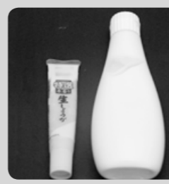
マヨネーズなどのチューブ