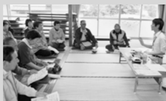
大川目町で行われた説明会の様子