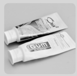
歯磨き粉のチューブ