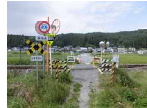
(左) 大崎本通線で拡幅される 墓通り踏切 (右) 湊源道線で拡幅される 第2新田踏切