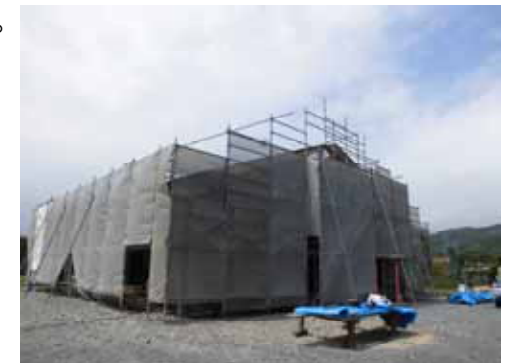
9月の完成を目指して建設が進められています

完成予定時期：平成26年9月 場所：夏井町大崎地区 施設概要：木造平屋建て、 延床面積 約208㎡ 事業費：約6,000万円