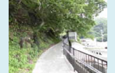
小袖地区に整備された避難路