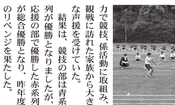
力に競技、係活動に取組み、観戦に訪れた家族から大きな声援を受けていた。結果は、競技の部は青系列が優勝となりましたが、応援の部で優勝した赤系列が総合優勝となり、昨年度のリベンジを果たした。

天候が心配されましたが、当日は天気に恵まれ、絶好の体育祭日和のもと、「一致団結」をスローガンに、青系列、赤系列に分かれて十一種目で熱戦が展開された。今年度も、コロナ禍の中での開催となったが、マスク着用、手指消毒、ソーシャルディスタンスの確保といった新型コロナウイルス対策を行っての体育祭となった。