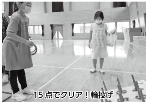
15点でクリア！輪投げ