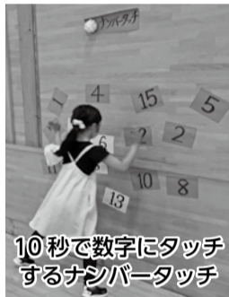
10秒で数字にタッチするナンバータッチ

が食べられます。お気に入りの味のかき氷に、まるで本物の縁日さながら子どもたちは大賑わい。今年度初めて、申し込んだ児童が全員揃い、みんながこの子ども縁日を待ちかねていた様子が伝わりました。