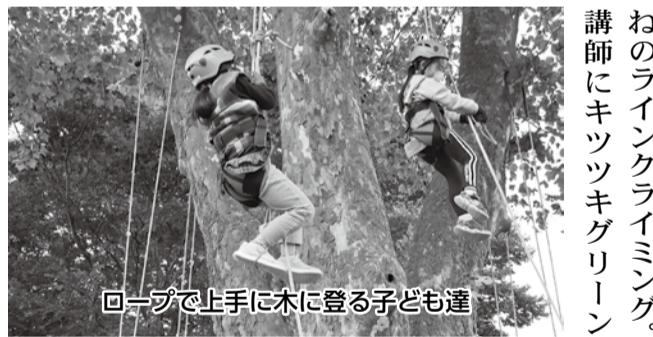
ロープで上手に木に登る子ども達

十月六日、侍浜市民センター事業の放課後子ども教室「浜っ子なかよしクラブ」の企画として、ライクライミング、しゃぼん玉、焼き芋体験が同センター敷地内で開催されました。 焼き芋が出来上がるまでの間にまずはしゃぼん玉作り。大きなしゃぼん玉を作ろうと子ども達は右へ左へ駆けまわります。上手に出来たしゃぼん玉は空高くまで舞い上がっていました。 さて、いよいよお待ちか