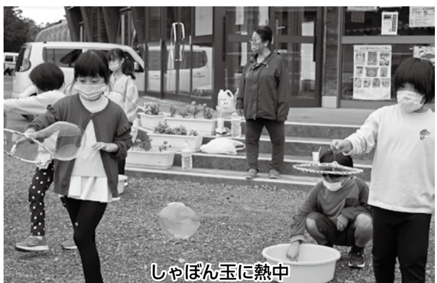
しゃぼん玉に熱中

を頬張り「おいしい」と満面の笑顔。おかわりする子どもも続出。スポーツの秋、食欲の秋を大いに堪能した一日となったようです。