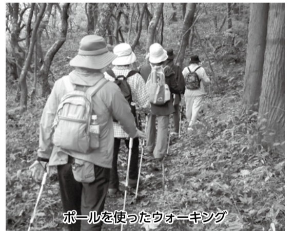
ポールを使ったウォーキング

トレイルコースはよく整備されていて、とても歩きやすかったです。倒木があったり、水が流れていたりと、また、野生動物のフンもありました。前を歩いた人が「気をつけて!」と声をかけてくれた。後ろの人も踏まずに歩くことができました。