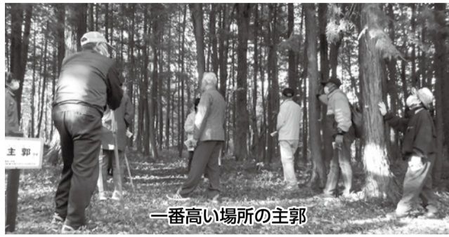
一番高い場所の主郭

そしていよいよ現地の見学です。大川目町に向かうバスの中では、久慈城が取り壊しになった後、現在の市街地に代官所が作られ、寺小路、役所小路などの名前が残っているという話を聞きました。町の中心が移ったことにより、久慈城跡は開発されずに保存状態が良く残ったようです。