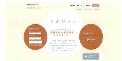
「とどけるん」のトップページ