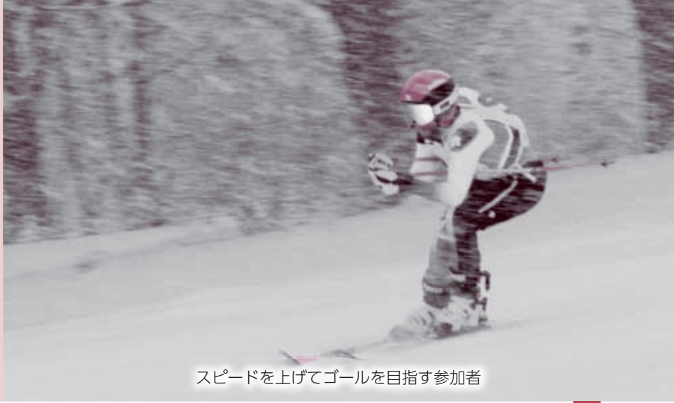
スピードを上げてゴールを目指す参加者