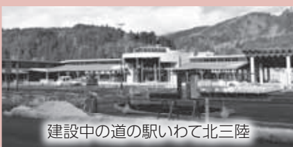
建設中の道の駅いわて北三陸