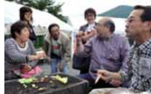
上 野菜や雑穀などを販売した初参加の霜畑営農研修館も連日盛況 中 食だけでなく体験なども大人気！ 下 山形の魅力を味わい、自然と笑顔に