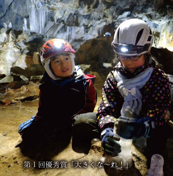
第1回優秀賞「大きくな〜れ！」