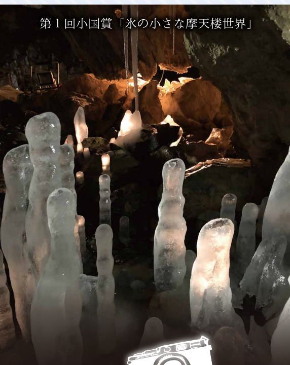
第1回小国賞「氷の小さな摩天楼世界」