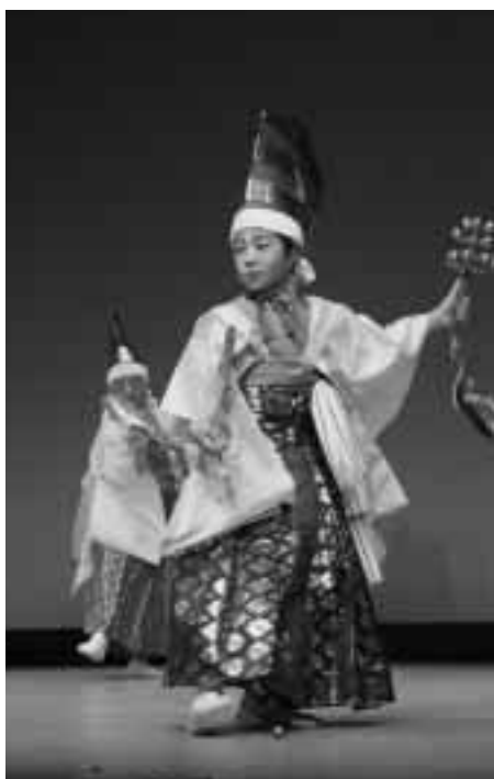
戸呂町神楽保存会の熱演

作品展示や舞台発表のほかにも、ペタンクなどのニユースポーツ体験会やホウキづくり体験も行われました。ホウキづくりに挑戦した方は、「ホウ生みたいにきれいにできない」と苦笑い。初めての体験に悪戦苦闘しながらも、楽しんでいました。