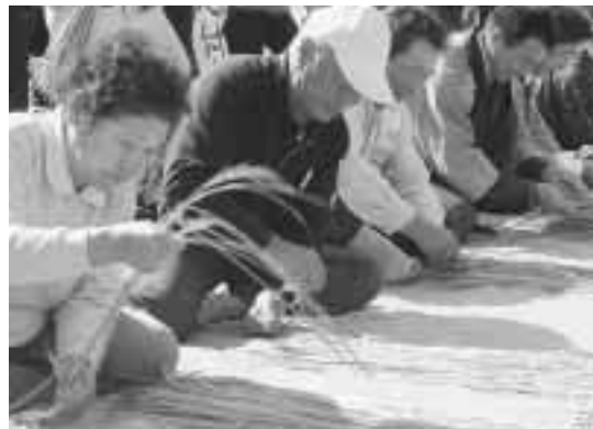
真剣な表情を見せる出場者たち

経験者の部の出場者は、さすがの手さばきを見せ、観戦していた人たちから歓声が上がっていました。最後に行われた団体の部には8チームが出場。地元の子どもたちやバツ