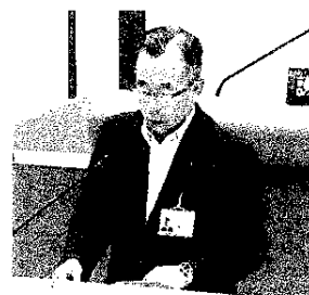
答弁する遠藤市長

【遠藤市長】市内の介護施設数は、デイサービスが19施設、グループホーム4施設、ショートステイは特別養護老人ホーム3施設で28床。利用者に対応できる適正な人員配置で運営されている。