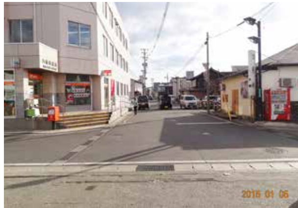
浸水による被害が多い久慈郵便局付近

【質問】 市街地の一部住宅は7、8年に一度ぐらゐの割合で床上浸水となり、抜本的な対策が望まれる。今後の洪水対策は。