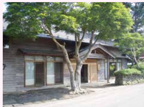
新たに整備された宇部学童さくらクラブ

17・4%です。 【質問】急勾配を原因とする事故が発生した場合の道路管理者の過失責任は。