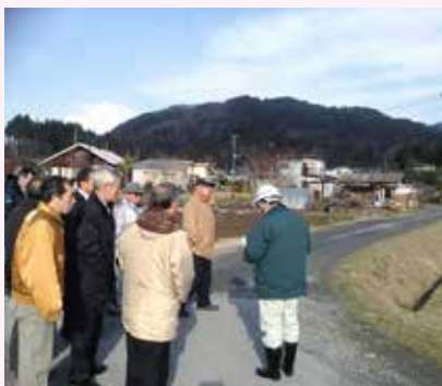
現地調査を行う産業建設委員会

小袖3号線は延長286・3m、舗装幅員4mで、市道上村三崎線に接続する路線であり、その縦断勾配は最大で