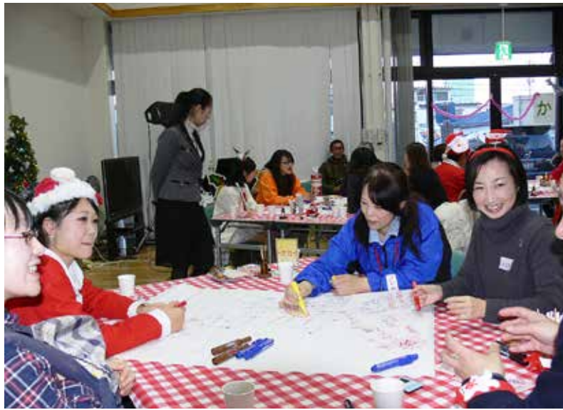
初開催となる女性かだつて会議は大きな盛り上がりを見せました。