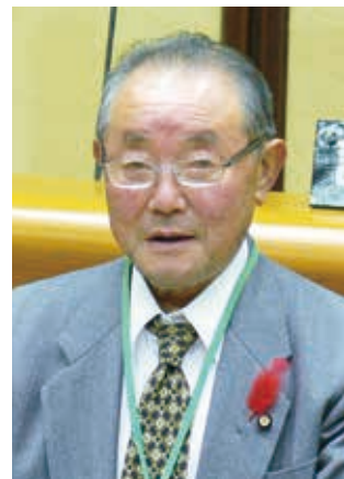
新国会 なかつか すみ お 中塚 佳男 議員