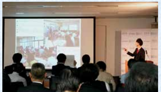
受賞式前日にはプレゼン研修大会が開かれました

て会議の設置」、「委員長志 願者の所信表明」、「ICT の積極的活用」、「基本条例 前文の方言化」、「他市議会 との友好交流協定の締結」 などの取り組みが高く評価 され、今回の受賞に繋がっ たものと考えています。 授賞式では、「これまで 多くの時間を「議会改革は 必要なのか」に費やしてきた。 議会基本条例を制定し、 今やつとスタートラインに 立つことができました。これか らも「じえいじえい」な議 会を目指していきたい」と コメントしました。