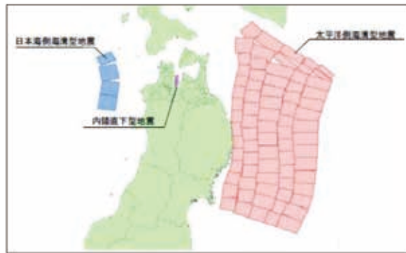
大規模地震の発生が想定される断層域 (青森県地震・津波被害想定調査資料より)

【質問】 八戸市において、最大で、2万5千人の死者が想定されるという「太平洋側海溝型地震」の発生によって、当市で想定される被害の状況と対策は。 【答弁】 岩手県では地震の被害想定について現在調査中であり、取りまとめ後、