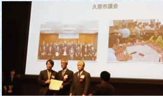
東京都で行われた受賞式の様子