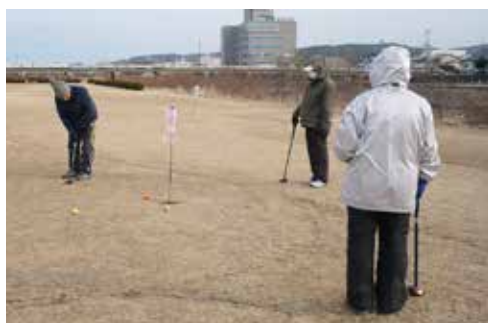
久慈川河川敷でスポーツを楽しむ市民

また、高齢者が外出し、他の人と触れ合うことを目的に市内92カ所での「ふれあいサロン」事業を実施している。温水プール