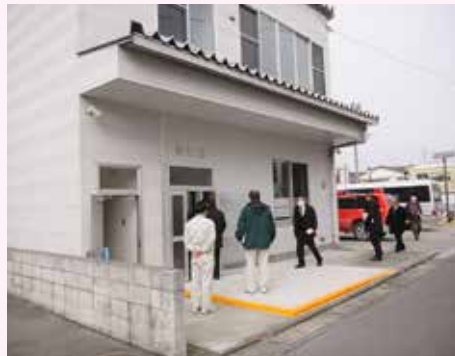
秋葉館を調査する総務委員会

あり、地元の町内会が使用する場合でも担当課への連絡が必要となる。また、管理は日誌などを活用し適切に行う。そのほか、避難訓練への活用方法、駐車場のスペースなどについての議論が交わされ、採決の結果、全員異議なく可決すべきものと決しました。