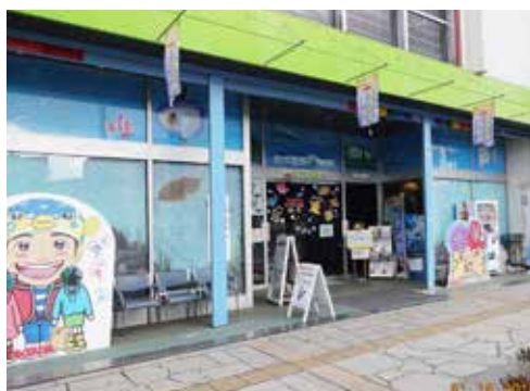
委託事業で実施されているまちなか水族館

性化に欠かせない存在であるが、運営には大変苦慮している。補助金の拡大などを求める声もあるが、当市の考え方は。