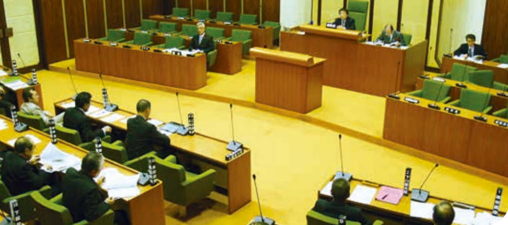
議員定数に関する調査特別委員会の様子