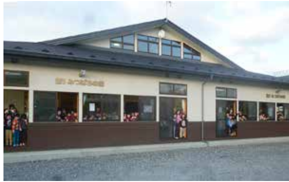
重要視される子育て支援 (写真は市内の放課後児童クラブ)

【質問】 子どもの医療費助成の拡充について、現物給付（窓口給付）を求める声が大きくな広がりをみせている。