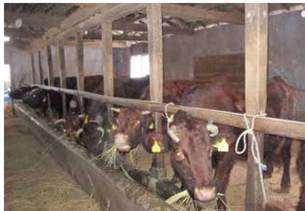
市内で飼育される肉用牛

を超え、日本短角種肥育牛の生産頭数は95%、販売額、繁殖牛の生産頭数、販売額は100%を超えていると新岩手農業協同組合から伺っている。