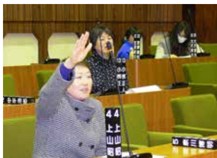
ツアー参加者からは積極的な質問が出ました。

日に「かだつてツアー」と題 した、議場見学会を開催しま した。 ツアーでは、普段なかなか 見る機会のない、議長室や委 員会室などを見学し、さらに 議場では実際に議席に座っ て、本番さながらの質疑を行 う、模擬議会を実施しました。