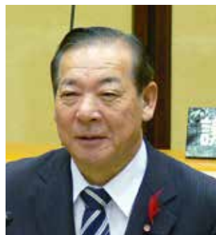
公明党 やまぐち けんいち 山口 健一 議員