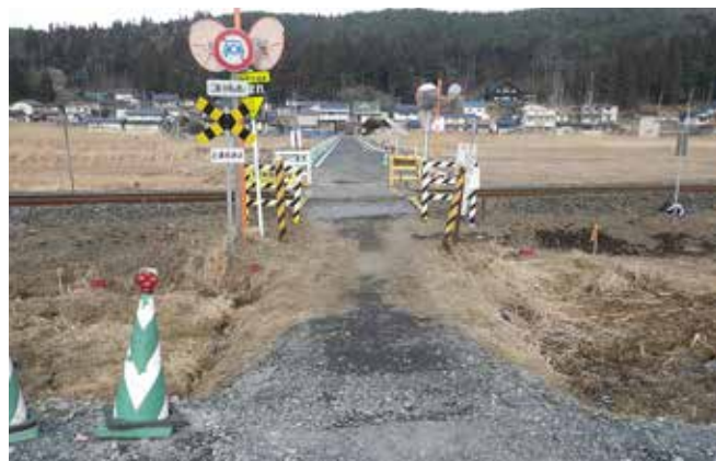
早期拡幅が望まれる第2新田通踏切