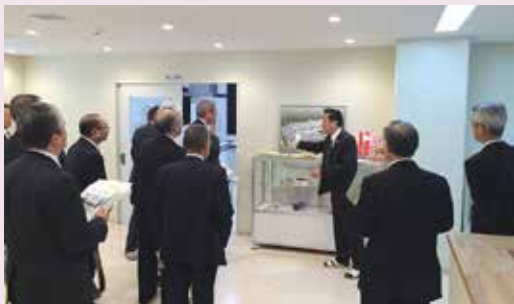
袖ヶ浦市で視察を行う委員会

主な視察箇所 袖ヶ浦駅海側特定土地区画整理事業エリア、袖ヶ浦駅南北自由通路 ほか