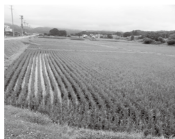
寺里地内の水田に並ぶ「いわてっこ」=水稲=県のオリジナル品種

質 主要農産物種子法が廃止された。これまでどおり農家に安価で安定的に種子を供給できるように、米・麦・大豆などの種子を生産・開発・普及するための条例制定を県に求めるべきと思うがどうか。 答 良質で安価な種子の供給が進むよう動向を注視し、農家の経営に支障がないよう必要に応じて国・県に要望していく。 質 市道川貫寺里線と国道281号の丁字路交差点への信号機設置を県公安委員会に対し強く要望すべきと思うがどうか。 答 この場所への信号機設置は、平成26年度から県への重点事項要望として継続して行っている。今年度も設置の実現に向けて取り組みを継続していく。 質 老朽化の激しい市民総合プールは、昨年の台風被害を受けて使用できなくなっている。これを機会に、久慈小学校区に新総合プールを計画すべきだ。 答 公共施設等総合管理計画の個別計画を策定する中で、再編も含め検討したい。