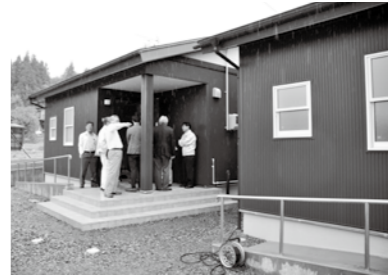
産業建設委員会の現地調査。全戸にスロープが設置されています

この条例改正は、老朽化の著しい宇部和野平地区住宅と宇部日向地区住宅を集約して建て替えるため、敷地造成と住宅の建設を行っていた「うべ団地」の一部を供用開始するものです。産業建設委員会で審査した結果、全会一致で可決すべきものと決しました。