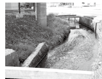
住宅側の用水路の擁壁が崩落・損壊し、増水時の浸水などが心配される上長内地区の市道沿いの用水路

質 市でも現地を確認している用水路の擁壁崩落箇所は、家屋などに直接的な被害が発生しなければ修復しないのか。 答 田んぼなどが無いため事業実施は困難。整備方法は引続き検討するが、当面危険箇所を特定して補修に努めたい。 質 職員がインターネットを利用して資料閲覧や外部とメールを送受信する場合、どのようなシステムを用いているのか。 答 インターネット接続環境で個人情報扱わないように環境を分離。新たにインターネット接続が可能な端末150台を導入して対応している。 質 観光ガイドの人材育成と受け入れ態勢の整備が急務であるが考え方を問う。 答 久慈市ガイドの会が安定して取り組めるように引き続き支援・連携していく。 質 市役所内の会議にタブレットを導入していく考えはないのか。 答 機器の更新時期や財源的な部分もあるが、提言を踏まえながら検討したい。