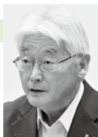
日本共産党久慈市議団