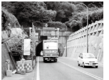
のり面工事に無水堀工法を採用し、工事費3,200万円を削減した山口県の工事現場（NETIS ホームページ）