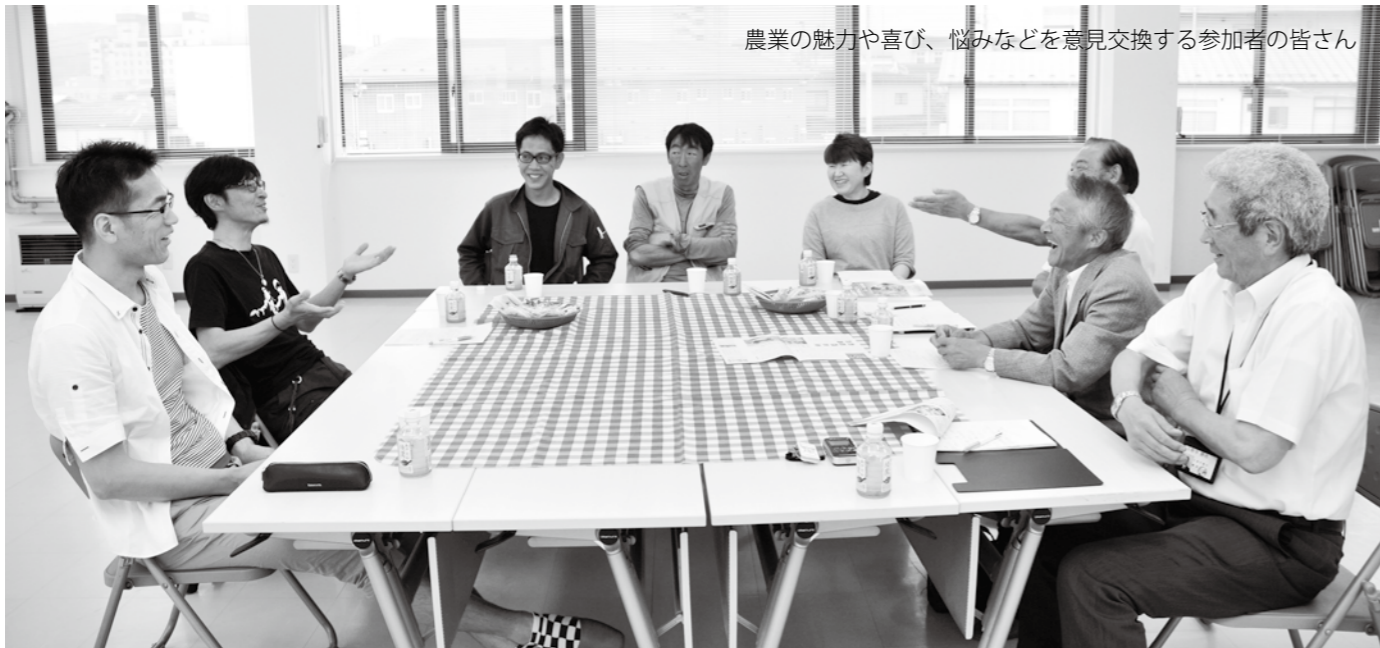
農業の魅力や喜び、悩みなどを意見交換する参加者の皆さん