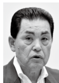
創政・公明クラブ