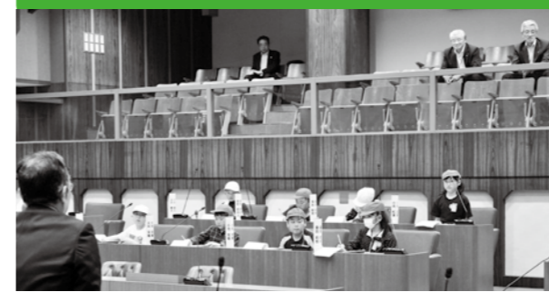
議席に立ち、堂々と遠藤市長に質問する侍浜小の児童