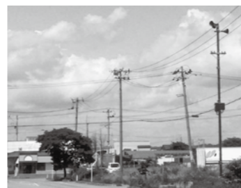
命を守る確かな情報伝達のための防災行政無線

質 大災害から命を守る確かな情報伝達が強く叫ばれている。企業などを始め、戸別受信機を整備すべきと思うがどうか。 答 屋内での防災情報の伝達方法として有効であると認識している。現在、導入方法などの検討を進めている。 質 東日本大震災で被災した久慈港玉の脇地区の作業灯が復旧されていない。船舶入港時の安全確保や防犯対策上、早期復旧が望まれているが、見直しを示せ。 答 昨年度に設置する予定だったが、台風第10号の災害対応のため延期され、今年度に設置予定と県から伺っている。 質 水産振興策として、各魚種の外来船誘致を積極的に進めていると伺っているが、具体的な見直しを示せ。 答 久慈市水産振興協議会が新規に巻き網船の誘致に取り組む予定。今回の一般会計補正予算に、外来船誘致活動の補助金を計上した。官民が緊密に連携しながら「オール久慈」で取り組みたい。