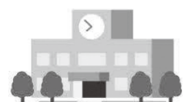
就学援助制度…小中学生の文房具や教材、給食などの費用を援助してくれる制度です

質 来年度から生活保護費が減額されるといふ報道があったが、生活が苦しい保護者に支給される小中学校の就学援助費も減額されるのか。 答 就学援助費の額は、文部科学省が実施する要保護児童生徒援助費補助金の単価を参考に、市教育委員会が定めているものであり、生活保護費に連動して削減されるものではない。 質 平成30年度の生徒会費とクラブ活動費は、就学援助費の対象となるか。 答 当初予算には計上していないが、今後、費目の追加に向けて検討する。