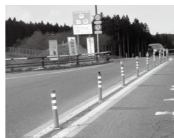
階上町にある中央分離帯。久慈道路も同様の視線誘導標が設置されています