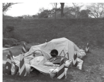
稲村団地の堤防のり面。堤防下からの漏水に備え、緊急用の砂をブルーシートで覆っています