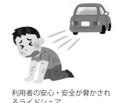
利用者の安心・安全が脅かされるライドシェア