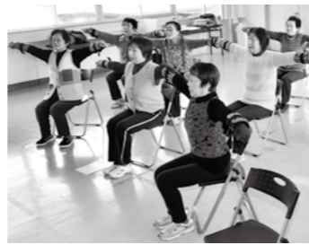
市内の各地域で継続的に取り組まれている「いきいき百歳体操」