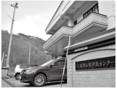
旧山根小中学校に移転した山根市民センター