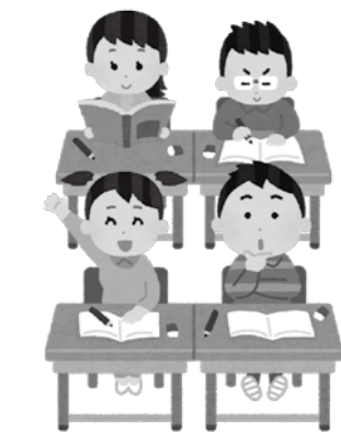
医療費の無料化が待たれる小学生たち

質 県は、小学生までの医療費窓口無料化について、市町村と協議し検討したいと言っている。市としても積極的に協議にのぞみ、早期実現を図るべきと思うが。 答 就学前までは平成28年8月から窓口無料化を実施している。小学生までの拡大は、県内で統一して実施する場合は対応する方向で検討を進める。 質 災害公営住宅法では、入居後3年経過し収入が基準額を超えると家賃が高くなる。市内でも5万円も高くなるという例も聞く。減額を検討すべきと思うが。 答 県や他市町村の対応を注視するとともに、市営住宅との整合性、公平性が保たれるよう検討していく。 質 大雨の浸水対策となる雨水ポンプ場の整備見通しは。 答 早期整備15カ所の内5カ所が完成。残る10カ所は栄町・田屋・川崎町西・田高・本町・荒町・十八日町・広美町・下長内・浄化センター脇である。