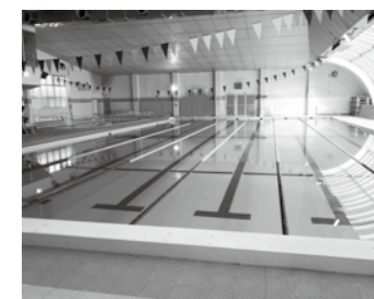
健康づくりに加え、介護予防への利用も期待できる温水プール