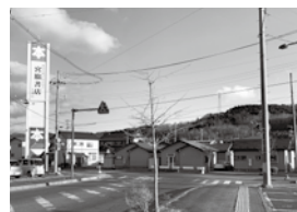
横断歩道と信号機が設置される宮脇書店付近の交差点