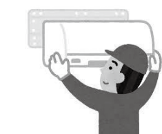
保健室に設置されることになったエアコン