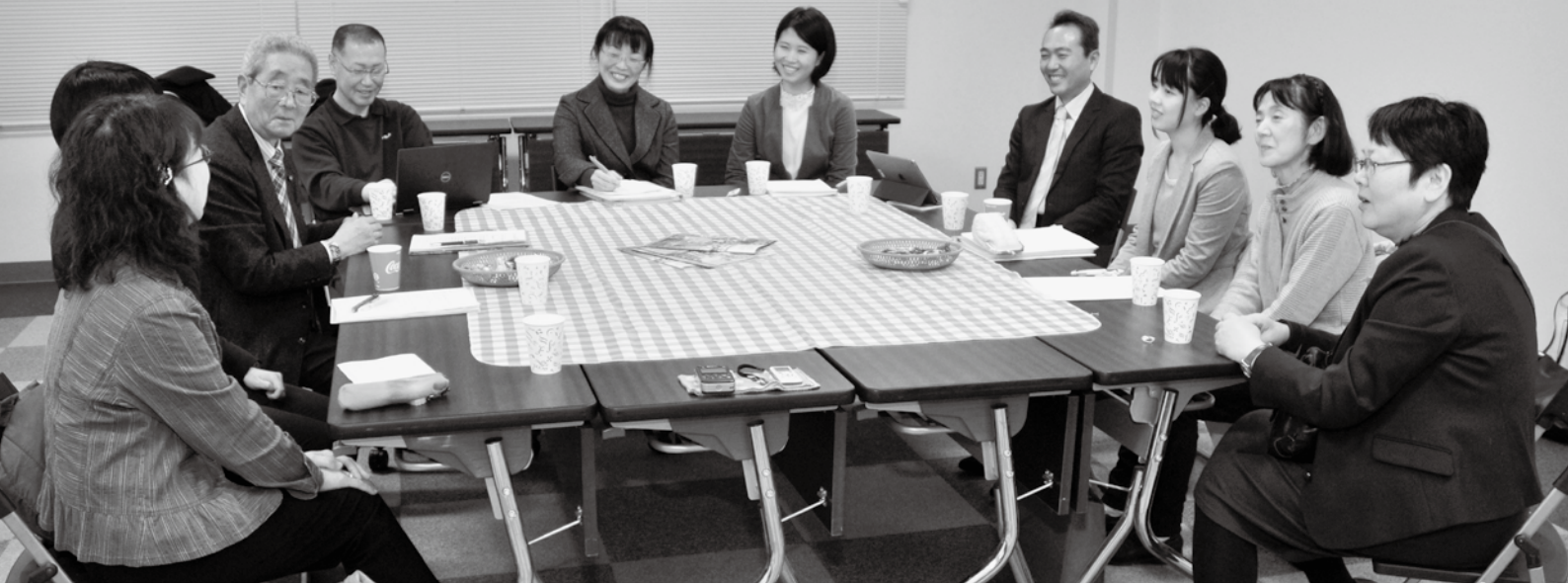
各学校の状況や対策を情報交換する参加者の皆さん