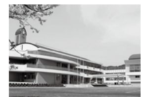
合併特例債を活用して建てられた久慈小学校