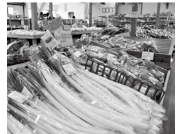
新鮮な地元野菜が並ぶ産直施設

この条例は、地産地消を推進する基本理念や、生産者・事業者・市民・市の役割、安全で安心な市内農林水産物の供給、食育の推進等の基本的事項を定め、農林水産業の持続的な発展と、市民の健康的で豊かな生活の実現に役立てるもの。産業建設委員会が審査した結果、全会一致で可決すべきものと決しました。（本会議…全会一致で可決）