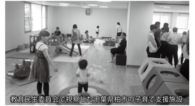
教育民生委員会で視察した千葉県柏市の子育て支援施設