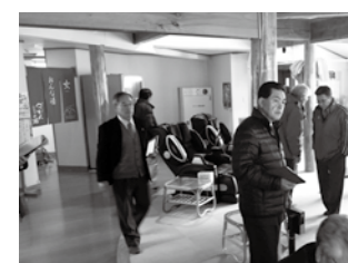
市交流促進センター・べっぴんの湯

今回の定例会議では、市の施設を管理する指定管理者となる団体を各常任委員会で審査し、70施設中69施設の指定管理者の指定を議決しました。議案第60号の市ふるさと物産センターについては、総務委員会で継続審査・再審査の結果、委員全員が反対。本会議でも前代未聞の賛成ゼロで否決されました。ここでは各常任委員会での審査の一部を紹介。審査の詳細(会議記録)はホームページをご覧ください。