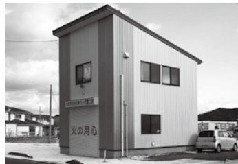
市消防団第5分団第2部の屯所。久慈地区の屯所は各分団等が所有、山形地区では市施設と取り扱いが異なる

【質】 旧市村で施設所有者が異なる消防屯所について、取り扱いの検討状況を問う。 【答】 屯所の維持管理経費は、市が全額負担している。今後に建てる屯所は、市施設とする方向で検討を進める。 【質】 消防団車両の改善策として、高床仕様やカーナビシステムを導入すべき。 【答】 今後、メーカーに車種や仕様の調達可能性を照会する。カーナビの有効性は認識しているが、財源等も含め検討する。 【質】 市道小久慈線から長内橋交差点への右折レーン工事の進捗状況を問う。 【答】 来年度に用地買収補償を進める。工事期間は約2年、全体事業費は約2億円、工事完了は最速で平成33年度である。 【質】 市道大川目線から林道柏木線の交差点にかけて道路を改修整備する考えは。 【答】 災害対応を優先するため中止しているが、来年度以降は予算確保に努めたい。予算規模は、市道大川目線の未改良区間140㍍などで約7千万円と試算した。