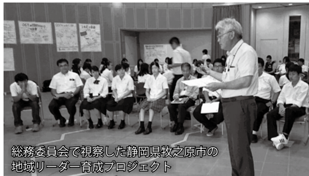
総務委員会で視察した静岡県牧之原市の地域リーダー育成プロジェクト