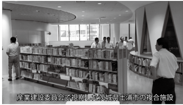
産業建設委員会で視察した茨城県土浦市の複合施設