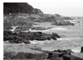
良好な天然磯漁場