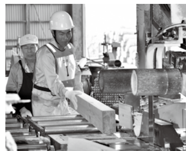
市内の製材所での木材加工作業