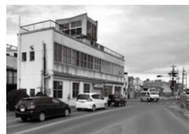
連日渋滞する市道小久慈線長内橋付近の交差点

質 市道小久慈線長内橋交差点における右折レーン整備の進捗状況は。 答 用地取得のため不動産鑑定、用地測量を実施中。工事完了は平成33年度を見込む。 質 当市の外国人労働者受け入れの現状と課題は。 答 平成29年10月末現在、外国人労働者を受け入れている事業所は25カ所、労働者は96人。住居の確保に関する相談等はあるが、課題はない。 質 スルメイカの記録的不漁が続いている。現状と課題は。 答 厳しい状況に直面していると捉えている。久慈市漁協と連携し、漁業共済を促す。