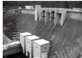
洪水調節などを行い、下流地域の被害を防ぐ滝ダム