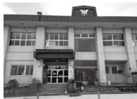
統合が検討される宇部中学校