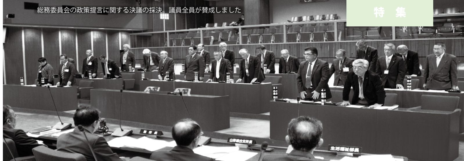
総務委員会の政策提言に関する決議の採決。議員全員が賛成しました