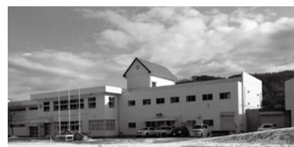
老朽化が進み、改築が望まれる山形小学校

【質】過去十数年、山形小学校の改築について「必要性は認識している」との答弁が繰り返されてきたが、その内容に全く前進が見られない。その理由は一体何なのか問う。 【答】山形小学校の改築については、老朽化に加え、屋内運動場が狭小であるなど、改築の優先度は高い施設と認識している。建築年が最も古く、津波浸水区域に位置する久慈湊小学校に続き、早期の改築に努めたい。