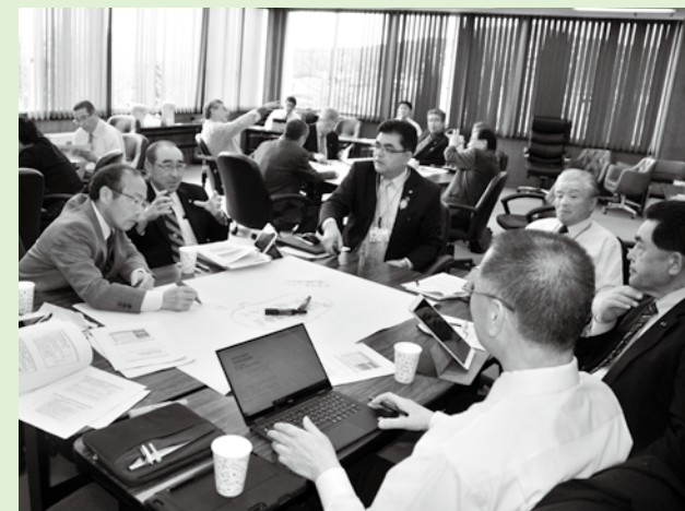
11月29日の議員全員協議会では、各常任委員会の調査内容を全議員の視点で確認。問題点や説明不足、調査不足の項目がないか意見交換しました。