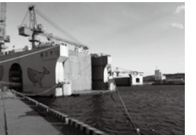
防潮堤に使われるケーソン製作が進む久慈港の様子