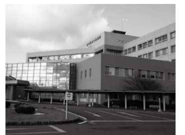
医師・看護師不足の県立久慈病院