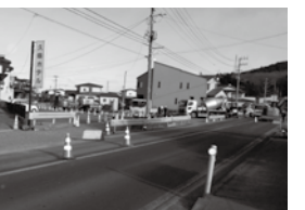
工事が進む広美町海岸線と国道281号の交差点