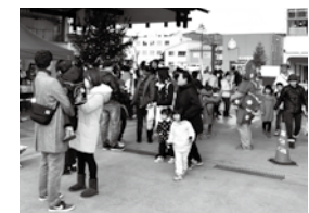
今年度の第1回冬の市。多くの人でにぎわいました