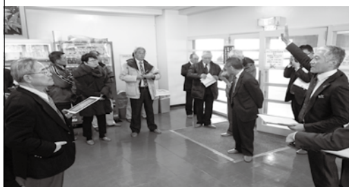
市担当者の説明を聴く各議員

12月13日、各常任委員会での審査に先立ち、山形B&G海洋センターや地下水族科学館など19施設を3常任委員会合同で現地調査。市担当課や現在の指定管理者から施設の管理・運営状況を聞き取るほか、実際に施設の現況を確認してきました。