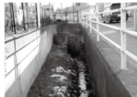
悪臭や防虫対策が懸念される旧久慈川幹線水路

質 当市に永住する外国人の親を持つ子どもなどに、日本語を教える日本語教師の育成採用が急務と思うが認識は。 答 日本語の指導が必要な小中学生6人に対し、個別指導などを行っている。当面は、日本語教師を採用せず、校内での人材育成を目指す。 質 旧基石ドライブイン駐車場付近の余水吐けから放流されているが、隣接する倉庫周辺がたびたび浸水している。今後の維持方針を示せ。 答 大雨時の取水制限を行うなど、大川目地区環境自然保全推進協議会、久慈市土地改良区と協力して対応したい。