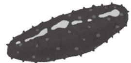
「つくり育てる漁業」の一つ、ナマコの増殖

質 市道二子小袖沢線の拡幅工事が6月に予算計上されたが、現在の進捗状況は。 答 当面、筆界が確定している区間を拡幅整備する。進捗状況は、測量調査・詳細設計業務委託を発注。今後は、用地取得や補償を進める。 質 ナマコの増殖など「つくり育てる漁業」の推進を行うとしていますが、来年度からのナマコ増殖の支援策は。 答 復興交付金を活用し、久慈産ナマコの成長過程の解析効果的な種苗放流マニュアルの調整、効率的な漁獲方法の検討、販路開拓などの取り組みを展開していく。