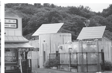
脱炭素先行地域に選定された山形町のソーラーシステム