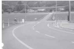
避難するための最短距離（防災公園園路より）