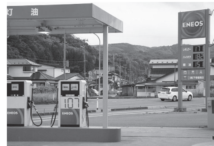
燃油類の高騰が続く市内のガソリンスタンド

第32回定例会議最終日に提案された一般会計補正予算第1号及び第33回臨時会議、第34回定例会議で提案された一般会計補正予算第2号・第3号を審議し、全会一致で可決しました。今回の補正は、脱炭素先行地域推進事業や、燃油価格高騰、物価高騰対策のほか、新型コロナワクチン接種対策事業費を計上しました。