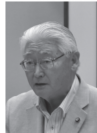
日本共産党久慈市議団