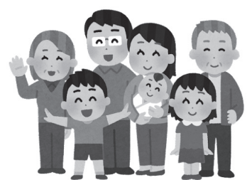
人口減少、少子化対策は早めの対応が必要だ