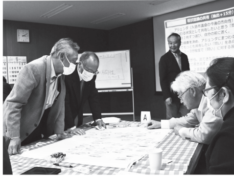
意見を出し合い、グループでまとめていく

申し送り事項は、これからの久慈市議会の更なる議会改革に向け議論を深めていかなければならず、一人ひとりがしっかりと実践してまいります。