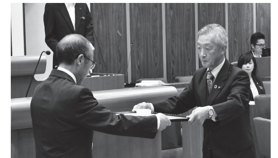
佐々木 栄幸 議員（議員在職 20 年以上）