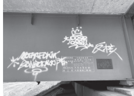
増えつつある橋脚等への「落書き」

質 大成橋や上の橋の橋脚等への落書きが年々目立つようになった。市の認識と対応を問う。