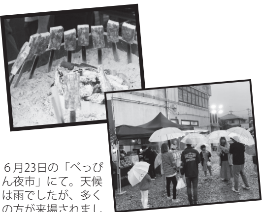
6月23日の「べっぴん夜市」にて。天候は雨でしたが、多くの方が来場されました。

「道の駅・いわて北三陸」の開業では、「ヤマセ土風館」にもお客さんが流れて良かったです。連携の具体化はまだですが、「ヤマセ土風館」も巽山公園や小鳩公園も巻き込んで滞在型の集客もできるのではないかと考えています。観光客は戻りつつあり「あまちゃん人気」も依然として強く、久慈市にとって大きな財産です。