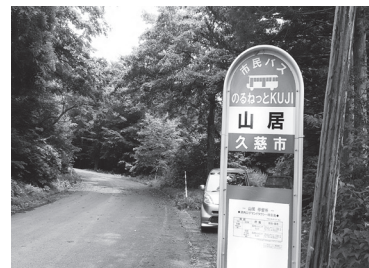
中崎まであと1.5キロメートルの位置にある山居停留所

その他の質問項目 ▶子育て支援策の充実を。砂子地区の高田川改修 ▶期日前投票所の増設を図れ ほか