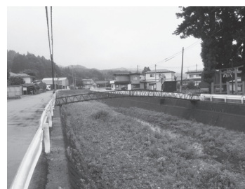
河川の流れを変える「切り替え工事」が行われる小屋畑川