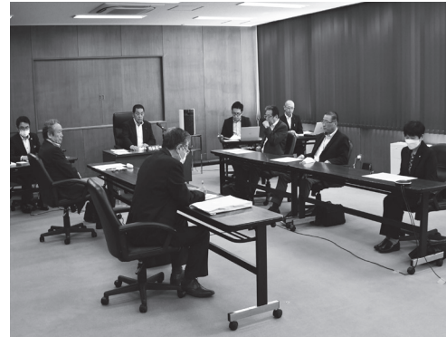
審査する産業建設委員会

【答】復興特区の制度による固定資産税の課税免除制度などがある。市内企業が、それぞれの状況等によって活用する制度を判断しているものと捉えている。