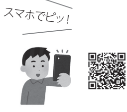
視察等の実績報告書は、QRコードからも閲覧できます