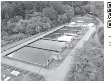
白山浄水場、雨はすべからく慈雨である「水は宝」

その他の質問項目 ▶災害時の偽情報対策、資源循環型の実現 ▶読書環境の整備 ほか