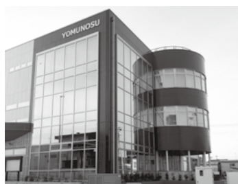
市街地活性化の核として期待されるYOMUNOSU

質 発熱外来やPCR検査などの地域医療体制の整備、避難所での感染症対策は。 答 今後の感染拡大に備え、久慈医療圏での地域外来・検査センターの開設に向け、久慈医師会及び久慈保健所と協議を行っている。避難所での感染症対策は、市の感染症に係る避難所対応方針に基づき対応することとしている。 質 駅前複合施設YOMUNOSU開業による市街地の活性化策は。 答 やませ土風館とYOMUNOSU間の回遊性を促進するため、質の高い施設運営に努めるとともに、べっぴん夜市等のイベントを継続するなど、集客力を商店街に波及させ、活性化を図る。 質 新市立図書館の具体的な運営内容は。 答 開館時間を午後7時まで延長、月末休館日の廃止、図書の一C化、セルフ貸出機による効率化、1回の貸し出し冊数を10冊に拡大、貸し出し期間を3週間に延長するなど、サービス提供に努める。