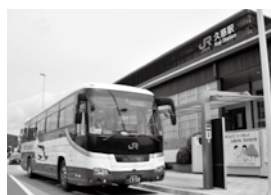
二戸と久慈を結ぶ重要な路線、JRバスのスワロー号