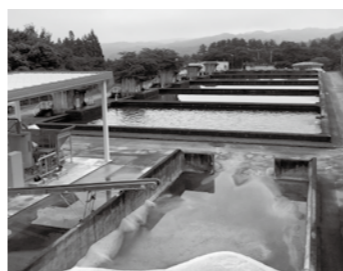
水を浄化して市民に飲料水を供給する白山浄水場