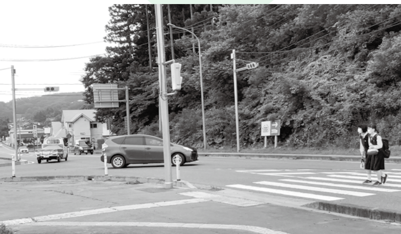
現在の大成橋丁字路交差点。信号機が設置され、歩行者が安心して渡ることができるようになりました