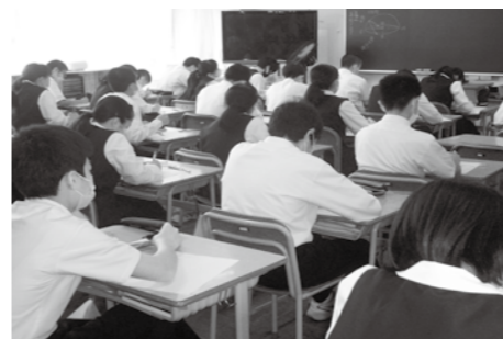
中学校の授業風景

が、それ以上に鳥取県の教員数が多いが、理由があるのか。 答 なぜ鳥取県がこのように力を入れているかということまでは、はっきりわかっていない。 質 先生の労働時間が過密になっているが、生徒の学力への影響はあるか。 答 忙しい中でも一生懸命努力しているので、学力が低いと思わない。