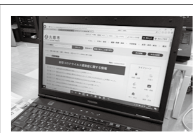
支援制度や関連情報の詳細は、市ホームページに掲載しています