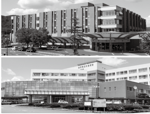
県立二戸病院(上)と県立久慈病院(下)。全国的な産婦人科医師の不足により、久慈病院での対応は正常分娩のみ。帝王切開などのハイリスク分娩は、二戸病院まで行かなければならない状況が続いています。