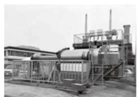
これまでに整備された雨水排水ポンプ場