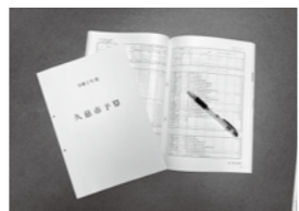
久慈市のお財布事情