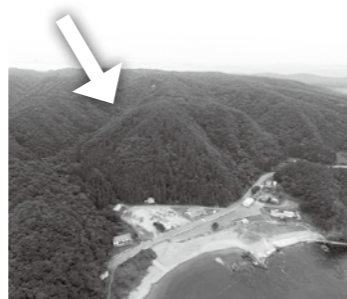
産業廃棄物最終処分場の建設が予定されていた舟渡海水浴場の裏山

質 札幌市の会社から地権者に、首都圏から産業廃棄物を海送り舟渡海水浴場の山手に100万㎡の最終処分場を建設する旨の手紙が送付された。市の認識は。 答 平成24年9月に県に対し事前協議書を提出後に取り下げ。本年6月10日現在手続きはされていないと伺っている。 質 国・県は新型コロナウイルスの検査件数等を各自自治体に情報公開すべきと考えるが。 答 新型コロナウイルス対策のため、国は首長に実数・実態を報告してほしいと思う。 質 霜畑小学校の閉校後の活用は。 答 地域の活性化につながる校舎の利用の仕方等を地元の方々と相談して進めたい。 質 広美町海岸線の渋滞に、不満の声が大きくなっている。工事の進捗状況は。 答 令和3年1月末に歩道を、3月末に車道を供用開始すると県から伺っている。 質 市道上長内平沢線の工事内容は。 答 河川・護岸・横断管渠の延伸及び防護柵の設置。舗装の予定はない。