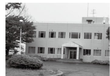
市民の新型コロナウイルスへの感染状況を把握することが期待される久慈浄化センター