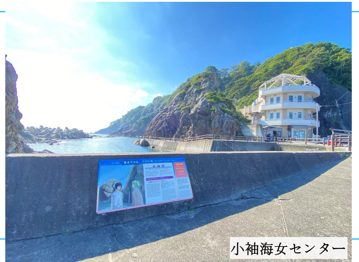
小袖海女センター

はじめまして、「くじし」です。 「くじ」はチャレンジする人を応援するまち。 第2の人生、第3の人生を歩むなら、「くじ」。 そう言ってくださる方が沢山います。 あなたも「くじ」へ夢を叶えにきませんか？